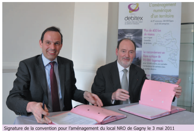
Signature de la convention pour l'aménagement du local NRO de Gagny le 3 mai 2011

* Noeud de raccordement d'abonnés : local télécom destiné à accueillir l'ensemble des lignes très haut débit d'une zone géographique