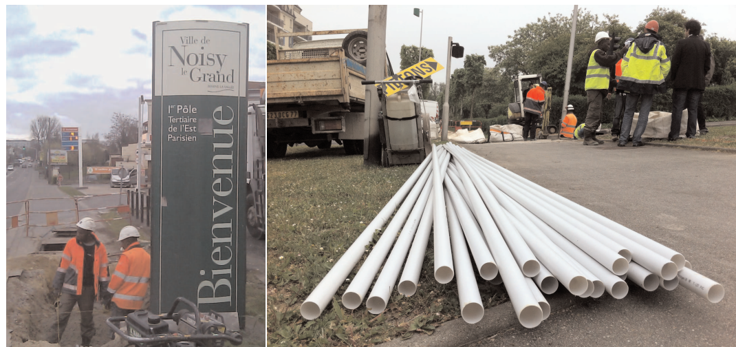
Ouverture de tranchées pour la pose des fibres optiques du réseau Debitex à Noisy-le-Grand, avril 2011

Cet autre chantier tout aussi important sera structurant pour la réussite du volet résidentiel du projet ! Nous aurons l'occasion d'en reparler ici même, dans votre toute nouvelle lettre d'information ! ●